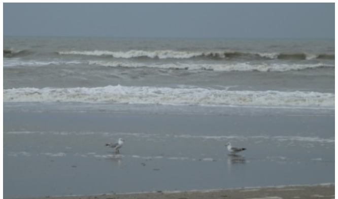
koud hè, vind je ook niet?

De 4 overige "DIE HARDS" heb ik afgebeld. De rit werd verplaatst naar het volgende weekend zondag 11 april en ik reken dan op prima weer, een maximale opkomst van 30 man en met hopelijk een goede scribent die een mooi positief verslag van deze Alternatieve Paasrit Versie 2 wil maken.