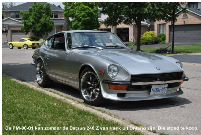
De PM-00-01 kan zomaar de Datsun 240 Z van Hank uit Ontario zijn. Die stond te koop.

Eén van de eerste zaken die de FEHAC lang geleden voor elkaar kreeg waren aparte klassieker kentekenseries voor geïmporteerde klassiekers. Die kregen een blauwe plaat met twee letters en vier cijfers. Dat was in 1988 en de gele kentekenplaat was 10 jaar daarvoor ingevoerd.