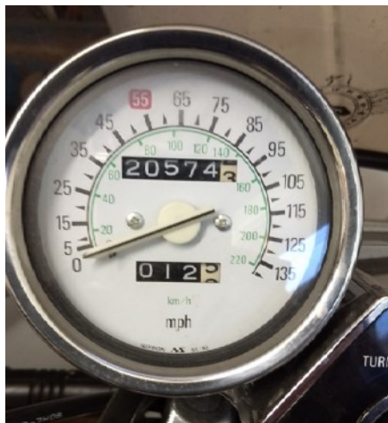
De originele teller

De teller weer op de motor gemonteerd en gelijk een stuk gaan rijden. Dat rijdt toch fijner dan met het constante omrekenen. Met GPS gecontroleerd of de schaalverdeling klopt. Exact goed. Niets op aan te merken. Ik ben dus heel blij met de hernieuwde teller.