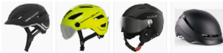
Speed Pedelec helmen