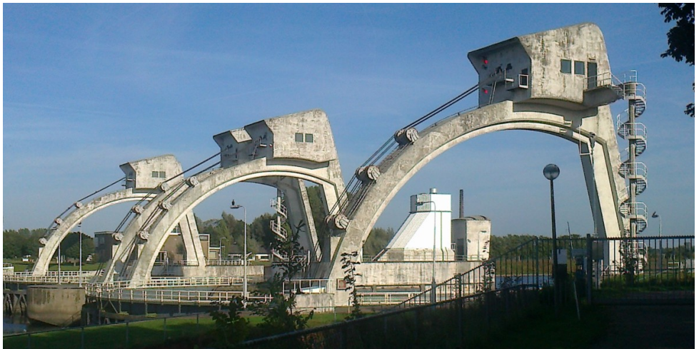
Stuw bij Hagestein