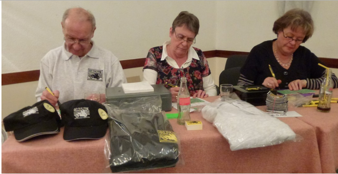
Uw bestelling wordt direct verwerkt