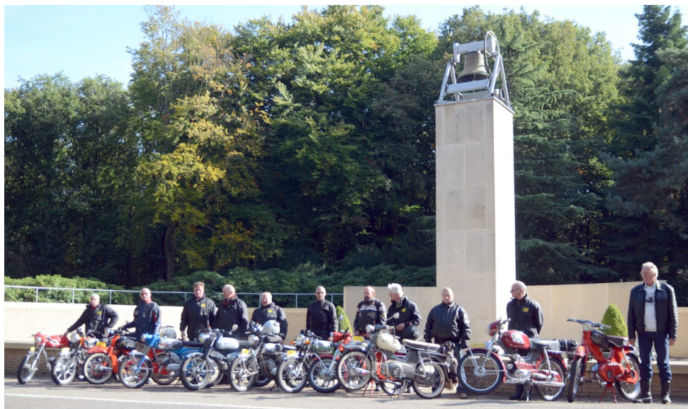
Groepsfoto bij het monument op de Grebbeberg

Op 30 september is de OMS superrit verreden.