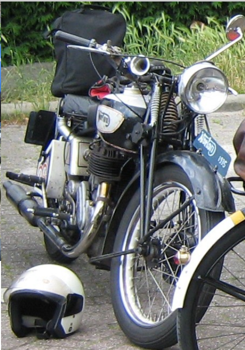
OMS in Gouda