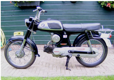
1969 de C320TS50

De trapas in het motorblok werd iets langer vanwege de halfhoge uitlaat en dit blijft voortaan zo. Kettingkast voortaan zilvergrijs.