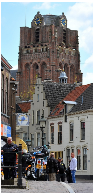
OMS in Utrecht