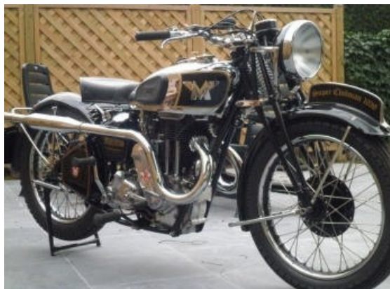
De G80 'Super' Clubman met o.a. zijn prachtige 'Upswept Twin Port' uitlaat.

Anno 2012 zijn er van het 1939 model nog slechts 2 gekende exemplaren: één in het Motor Museum van Birmingham en één in Wieze, op 11 & 12 februari!